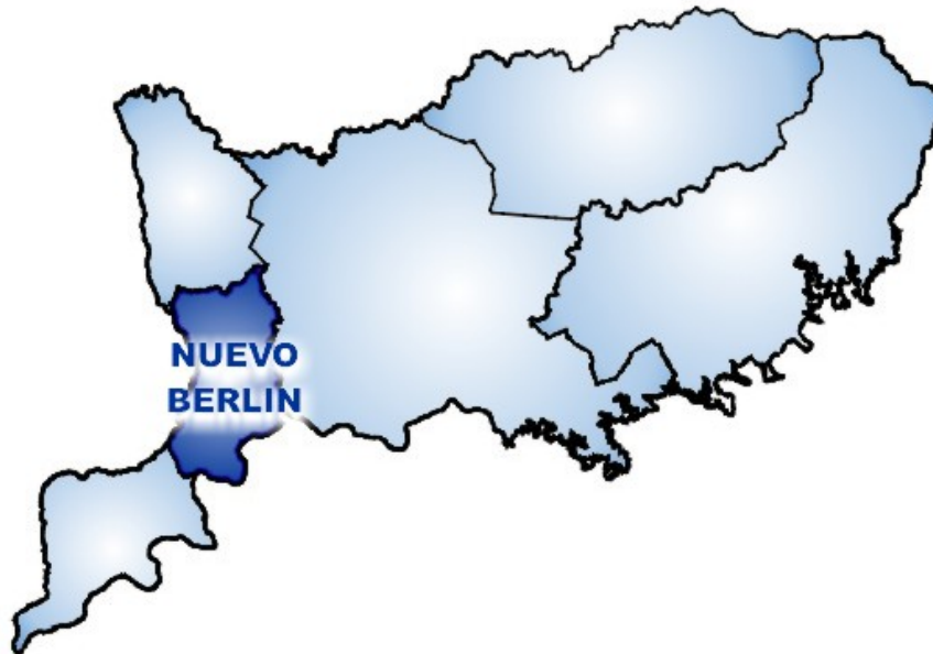
Figura 1. Ubicación del Territorio de Nuevo Berlín.