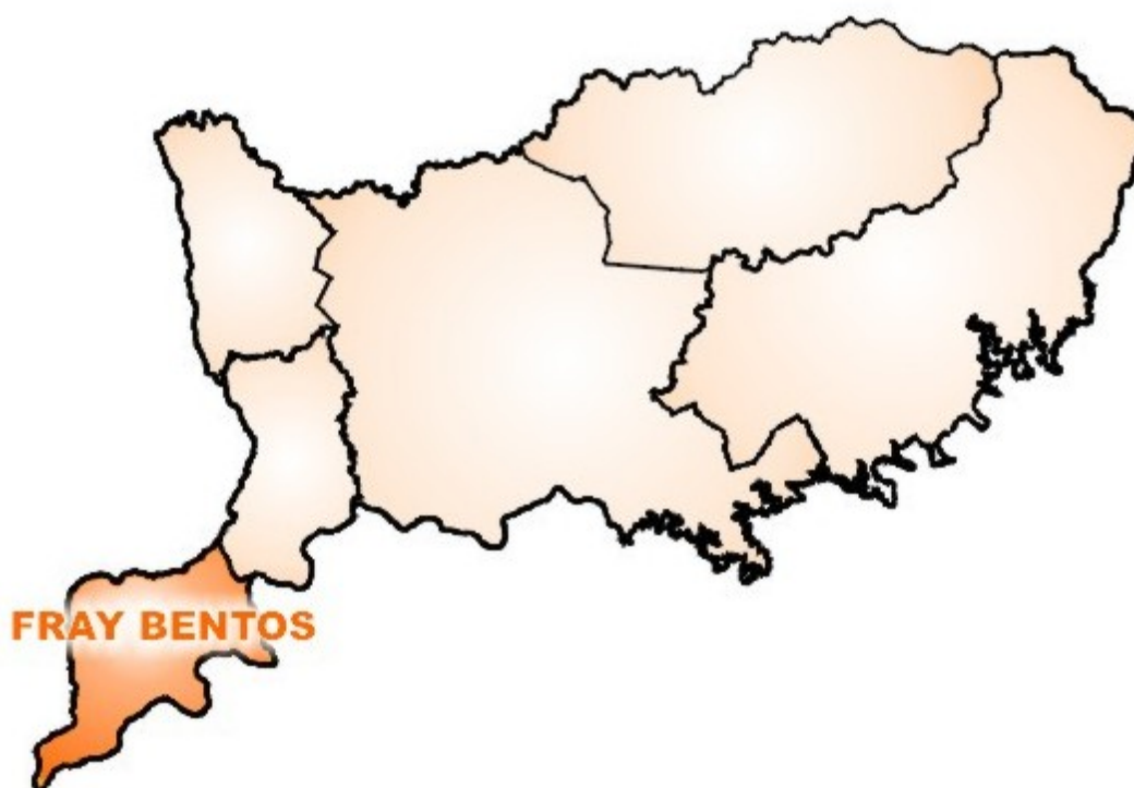
Figura N° 1. Ubicación del Territorio de Fray Bentos.